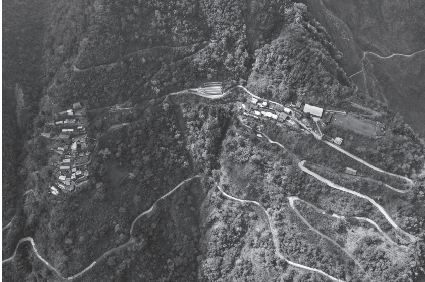
圖 1 上部落（左）與下部落（右）的相對位置