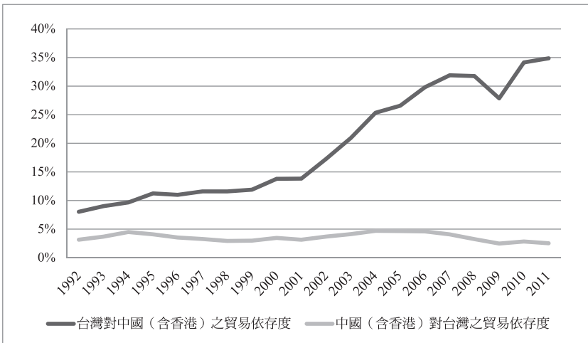
圖 1 台灣與中國相互之貿易依存度比較，1992-2011 年

示，中台兩方之相互的貿易依賴結構極為不對稱；台灣已經形成對中國市場高度的出口依賴。反之，中國由於經濟規模遠大於台灣，貿易對象也較為分散，因此對台灣的依存度極低。簡言之，兩岸的經濟權力不對稱現象，致使台灣在政治經濟變動下，顯得脆弱、而且易受影響。