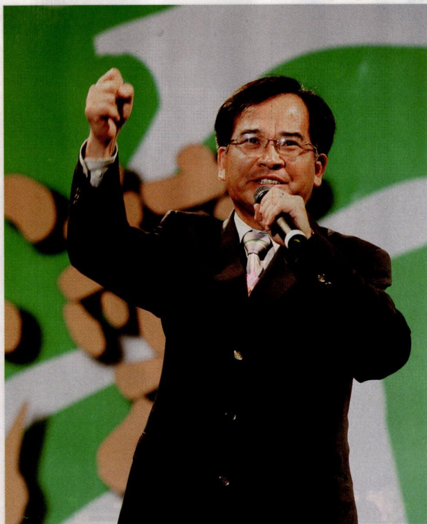
蘇煥智是最年輕的黨主席候選人

如何讓民進黨重新執政？蘇煥智強調不能靠選舉路線，而是要靠「新公民運動」。他的想法似乎以他在台南縣的施政經驗為基礎。他曾經在台南縣設立二十七個「村里關懷中心」，以很少的經費、動員當地的志工從事老人照顧。他主張未來民進黨的地方黨部也要成立弱勢關懷中心。